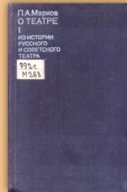
Марков, П.А. О театре : в 4 т. / П. А. Марков. - Москва : Искусство, 1974 – 1977. - 4 т.

Четырехтомник Маркова отражает особенности развития театральной науки, а также развитие взглядов самого автора. Создававшиеся в различное время, работы Маркова обусловлены этим временем и несут на себе его отпечаток.