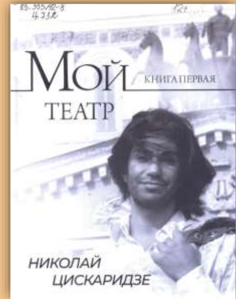
Цискаридзе, Н. М. Мой театр : по страницам дневника : в 2 книгах / Николай Цискаридзе. - Москва : АСТ, 2022-2024. - 2 кн.

Значительная часть фотографий в данном издании публикуется впервые.