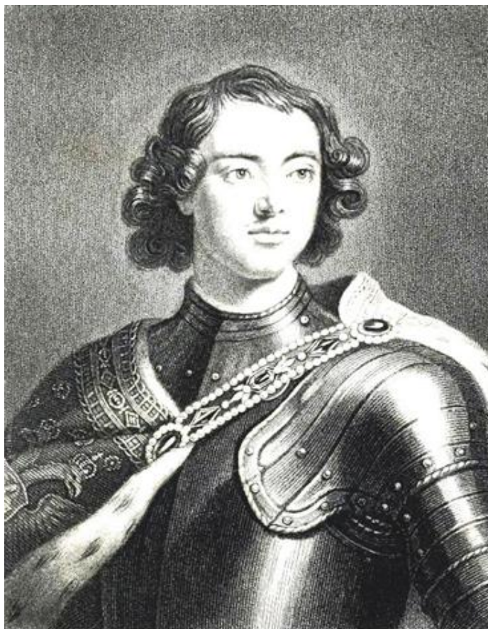
П.Гунст «Петр I» гравюра с портрета работы Г. Кнеллера

В 1700-е годы возникла потребность в модернизации контрольно-надзорного органа с иерархичной структурой и весомыми полномочиями, которым стал фискалат. Следует отметить, что поиском эффективного механизма контроля занимались еще в период основания централизованного государства. В статье рассматривается процесс формирования системы надзорных органов и органов контроля в период правления Петра I.