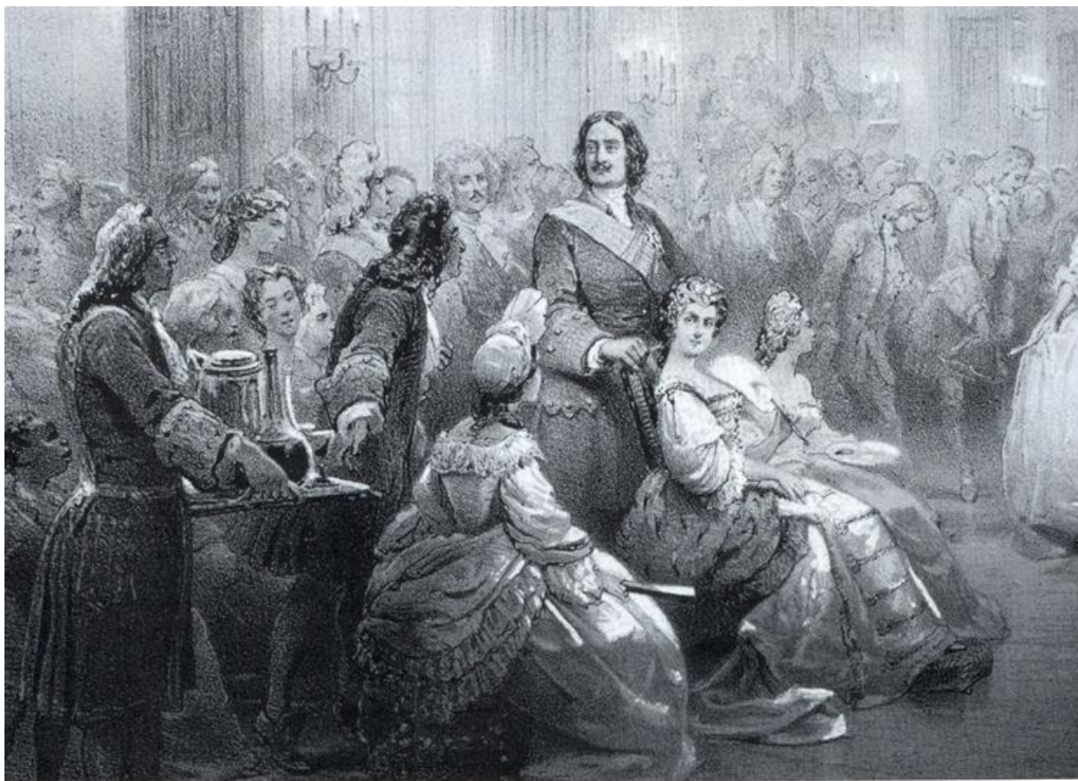
Ассамблея при Петре I. Фрагмент литографии по рисунку К.В.Лебедева

Делается упор на конкретные мероприятия в экономической отрасли, а также на то, как они воплотились в современной форме в Российской Федерации. Более того, в статье описываются мероприятия в социальной сфере, которые изменили быт и нравы дворян XVIII в., и преобразования современной общественной жизни в России. Рассматриваются отдельные аспекты в изменении положения столицы государства и функций, возложенных на отдельные регионы страны.