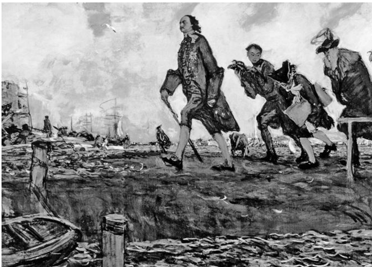
В. Серов «Пётр на постройке Петербурга»

учреждений. Европейцы и россияне очень полюбили этот город. Русский народ за великие дела назвал Петра I Великим.