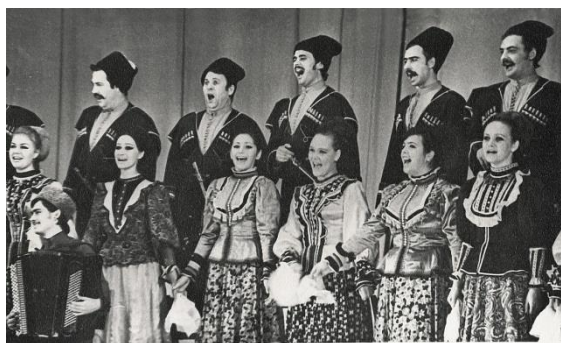
ГОСУДАРСТВЕННЫЙ КУБАНСКИЙ КАЗАЧИЙ ХОР Москва 1975 г.

Всего за несколько месяцев он подготовил с артистами совершенно новую концертную программу на основе народных казачьих песен. В 1975 году хор стал лауреатом I Всероссийского смотра-конкурса государственных народных хоров в Москве. Со