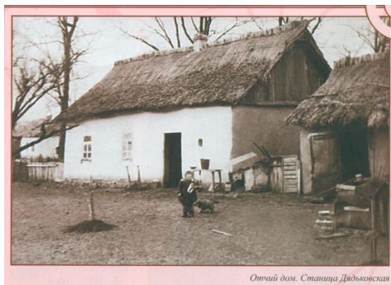
Отчий дом. Станица Дядьковская

Итог его труда губернатор Краснодарского края Вениамин Иванович Кондратьев оценил словами: "Пока есть такая духовная сила – будет культура, будет Кубань, будет великая наша страна".